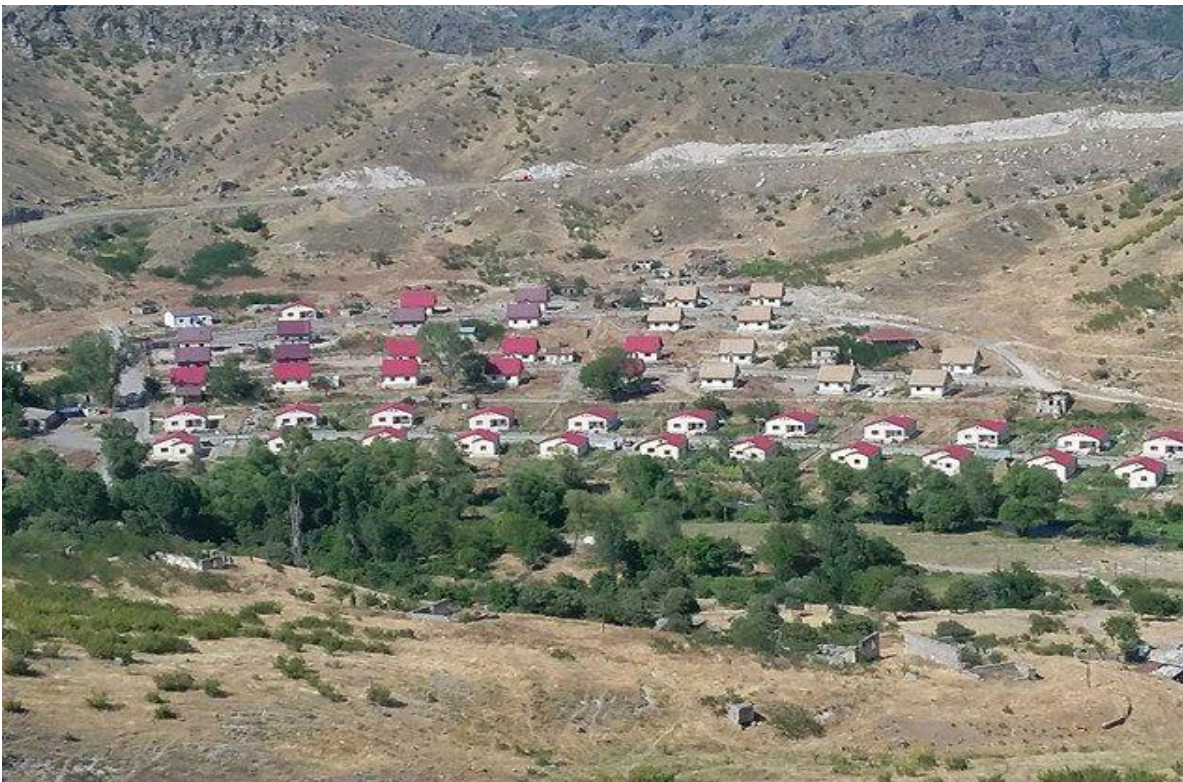
Աղավնո գյուղի ընդհանուր տեսքը