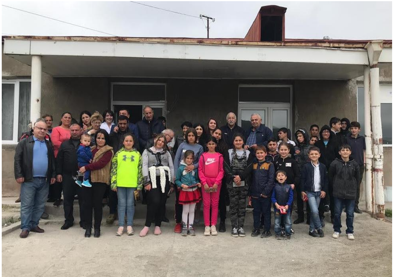
Աղավնո դպրոցի մուտքի մոտ

ՀՈԳԱԲԱՐՁՈՒԹՅԱՆ ԽՈՐՀՐԴԻ ԱՐՏԱԳՆԱ ՆԻՍՏԸ ԱՐՑԱԿԻ ՀԱՆՐԱՊԵՏՈՒԹՅԱՆ ԱՂԱՎՆՈ ԳՅՈՒՂՈՒՄ