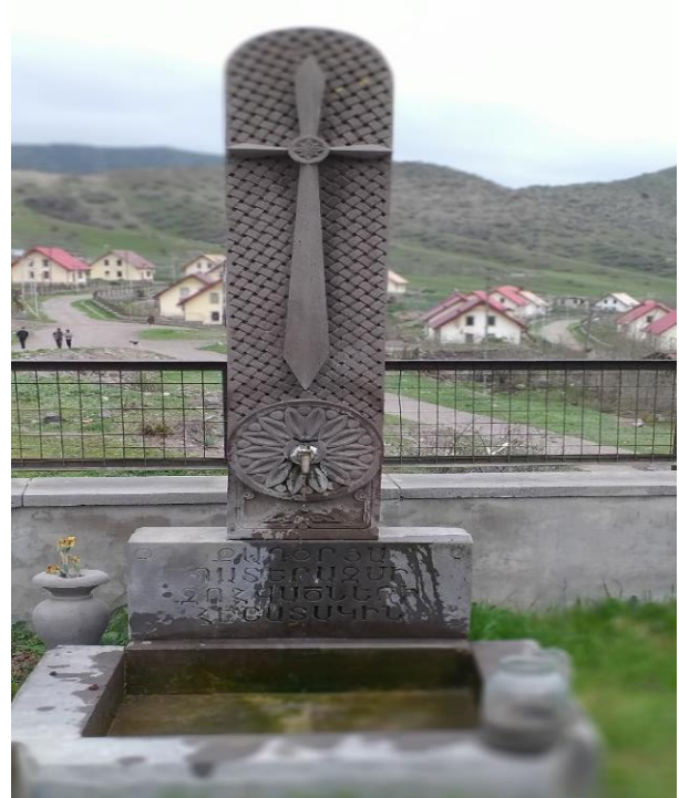
2016 թ. ապրիլյան քառօրյա պատերազմում զոհվածների հիշատակի աղբյուր-խաչքարը Աղավնո գյուղում