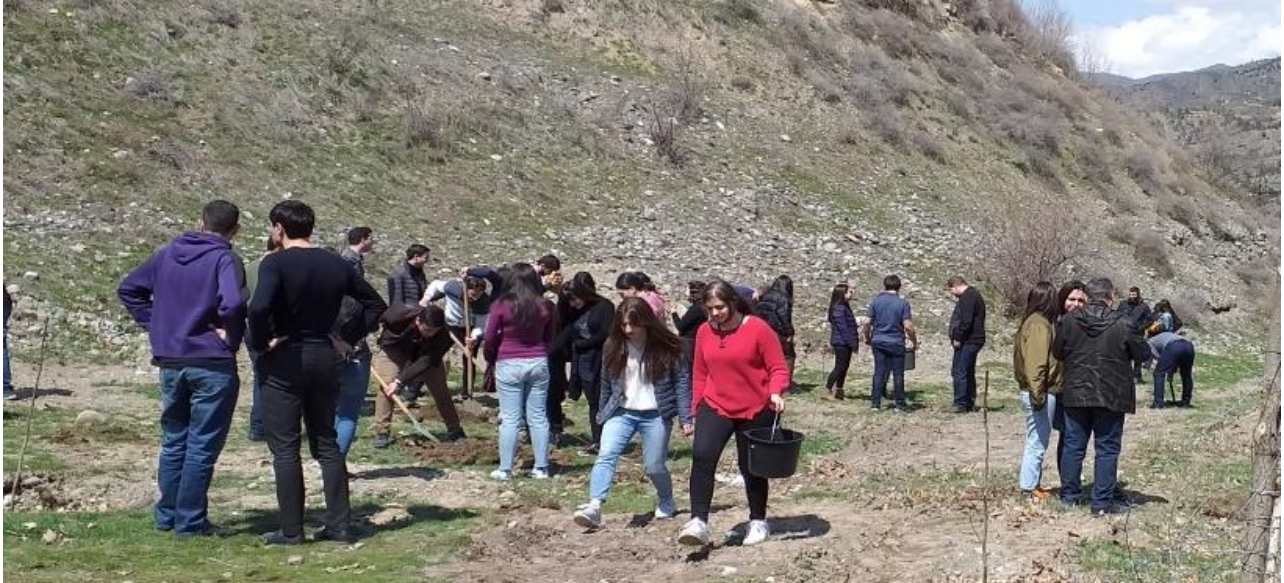
Գարնանը այսպիսի խանդավառությամբ իրականացվեց ՏԵՊՐ 100-ամյակի այգու՝ ծառատունկը