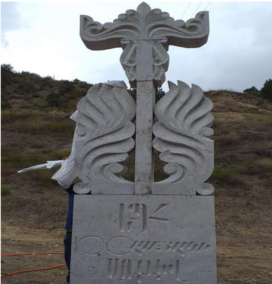
ԵՊՀ 100-ամյակի այգու հուշաքարը Բերձորում

ԵՐԵՎԱՆԻ ՊԵՏԱԿԱՆ ՀԱՄԱԼՍԱՐԱՆԻ 100 – ԱՄՅԱԿԸ