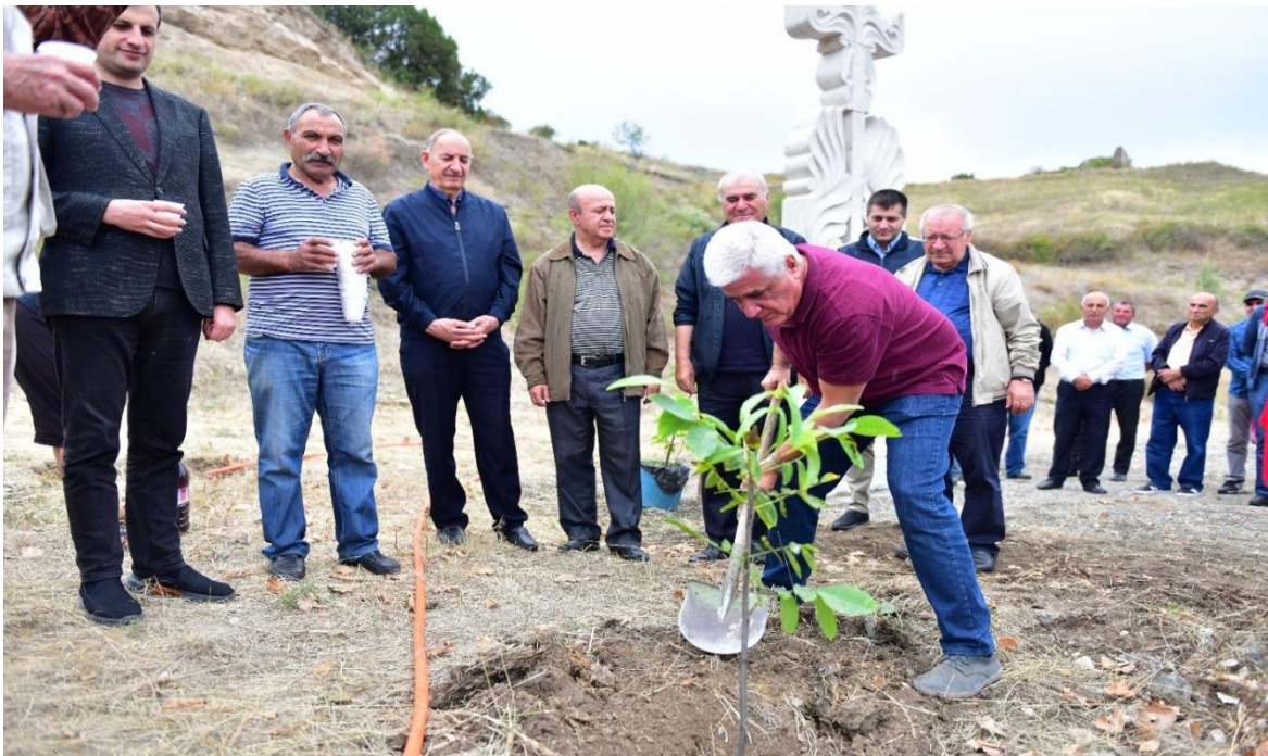
Աշխատեցին ՏԵՊՐ 100-ամյակի այգու՝ հուշաքարի բացման արարողությունից հետո տնկվեց խորհրդանշանական ընկուզենին: