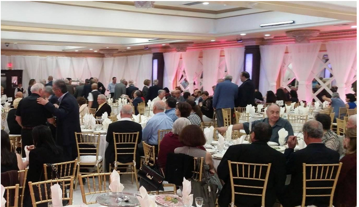
Մի դրվագ «Միփան» սրահում կայացած ավանդական դրամահավաքից, որը միշտ էլ ընթանում է ջերմ մթնոլորտում

Դրամահավաքը կամ հանգանակությունն առհասարակ դժվարին բան է, բայց հաճելի է դառնում, երբ ունենում է համազգային բարեգործական ազնիվ ու վեհ նպատակներ, երբ գիտես, որ այն նպաստելու է վերաշինվող հայրենիքի բարգավաճմանն ու մեր հայրե-