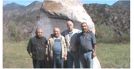
Գրողի հիշատակը հավերժացնող կոթողի մոտ՝ «Ստեփան Ալաջաջյան» պուրակում

Երևանի պետական լսարանի արևելագիտության ֆակուլտետում հոկտեմբերի 24-ին