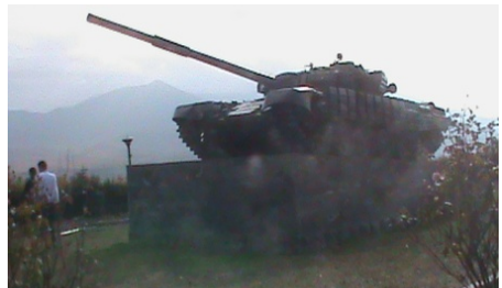
Տանկը ևս հուշարձան է դարձել...

Սակայն այդ ամբոխը չորս կմ խրվել էր մեր սահմանը և հասել մինչև այստեղ, ավերել էր ոչ միայն շրջակա հայկական գյուղերը, այլևայնպես ու նավթաբազան այլև հեկտարներով նորատունկ այգիներ: Մարդիկ դիմել են հարկադիր ինքնապաշտպանության՝ չենթարկվելով ոչ Բաքվի, ոչ էլ Մոսկվայի որոշումներին: Պատերազմ է եղել, զոհեր ենք տվել, վիրավորներ ունեցել... բայց հետ ենք չարտել թշնամուն: