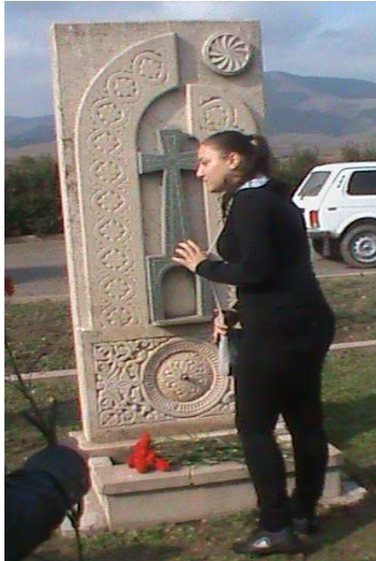
Գերոսները չեն մոռացվում...

- Մեր անվտանգության ամենահուսալի երաշխավորը, - ասաց պրն վարչապետը,- մեր բանակն է, որ այսօր ավելի մարտունակ է, քան երբևէ: Գիշտ է, որ բանակում լինում են նաև անկարգության դրսևորումներ, բոլորիս համար անցանկալի դեպքեր, բայց ո՞ր բանակում չկան դրանք, կարո՞ղ եք ասել: Մի երկու անցանկալի միջադեպերը բանակը վարկաբեկելու պատճառ չեն: