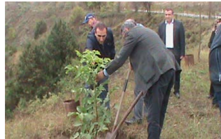
Շառատունկ «Ստեփան Ալաջաջյան» պուրակում:

թուն թաղամասի առաջին բնակիչներից մեկը: Մինչև իր ճակատագրական հիվանդությունը նա ապրեց հայրենիքում: Եվ քանի որ իր կերպավորած հերոսների պես ի բնե ուներ հայ լինելու, հայ ապրելու և հայ ապրեցնելու հզոր կամք ու ձգտում, թե՛ որպես գրող ու գրական կյանքի կազմակերպիչ, թե՛ որպես ազգային գործիչ իր բոլոր ուժերը անմնացորդ նվիրեց անմնացորդ նվիրաբերեց մայր ժողովրդին ու մեր հայրենիքին: Նա ստեղծել է անմահ երկեր, որոնք, գեղարվեստական ու ճանաչողական բարձր արժեքներ լինելով, մեր ժողովրդի գրական մտածողությունը մոտեցրեց արդի համաշխարհային գեղար-