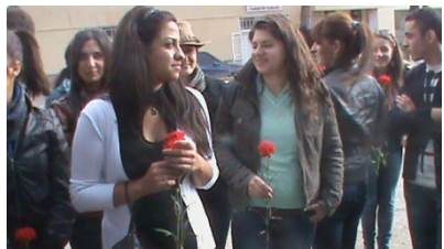
Պատրաստվում են զոհվածների հուշարձանին այցելության

Այստեղ զոհվածների հիշատակին խաչքար է կանգնեցված, որին ծաղիկներ դրին աշակերտներն ու ուսանողները, իսկ պատվանդանին բարձրացված տանկը այդ ողբերգական ու հերոսական օրերի լուռ վկան է: