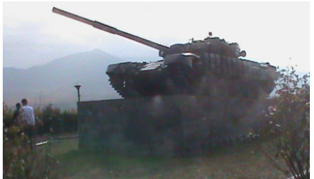
Տանկը ևս հուշարձան է դարձել...

մարտիկները, և ոչ թե ոմն Խուրաման խանումի՝ ամբոխի ոտքերի տակ նետած լաչակը, ինչպես այդ խայտառակությունը շտապեցին աշխարհին ներկայացնել Բաքուն ու Մոսկվան երթը ուրակելով որպես խաղաղասեր ու մարդասեր ազերի ժողովրդի «բարի կամքի» դրսևորում: Սակայն այդ ամբոխը չորս կմ խրվել էր մեր սահմանը և հասել մինչև այստեղ, ավերել էր ոչ միայն շրջակա հայկական գյուղերը, այլև ռազմաբազան այլև հեկտարներով նորատունկ այգիներ: Մարդիկ դիմել են հարկադիր ինքնապաշտպանության՝ չենթարկվելով ոչ Բաքվի, ոչ էլ Մոսկվայի որոշումներին: Պատերազմ է եղել, զոհեր ենք տվել, վիրավորներ ունեցել... բայց հետ ենք շարտել թշնամուն: