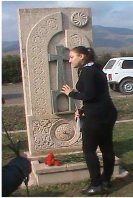
Հերոսները չեն մոռացվում...

- Մեր անվտանգության ամենահուսալի երաշխավորը, - ասաց պրն վարչապետը, - մեր բանակն է, որ այսօր ավելի մարտունակ է, քան երբևէ: Ճիշտ է, որ բանակում լինում են նաև անկարգության դրսևորումներ, բոլորիս համար անցանկալի դեպքեր, բայց ո՞ր բանակում չկան դրանք, կարո՞ղ եք ասել: Մի երկու անցանկալի միջադեպերը բանակը վարկաբեկելու պատճառ չեն: