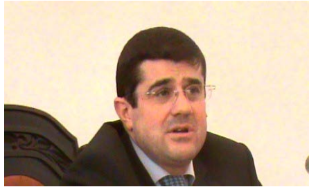
ԼՂՀ վարչապետ պրն Ա. Հարությունյանը ԵՊՀ պատվիրակներ հետ զրույցի պահին

կհարձակվեն, բայց դա տեղի չի ունենա, քանի որ նրանք գիտեն, որ այդ դեպքում իրենք կստանան արժանի հակահարված և շատ խիստ կպատժվեն: Իսկ այս իրավիճակը կպահպանվի այնքան ժամանակ, մինչև նրանք հարկադրված լինեն ճանաչել իրենցից ազատագրված Արցախի պետական անկախությունը: