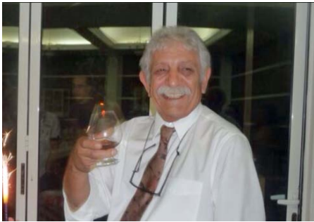
Այսպես կենսափոխ էր նա ու հավատով լեցուն...

Երկրային իմաստավոր կյանքը դժվար է տրվում մարդուն. ավելի ճիշտ՝ մարդն ինքն է բովանդակավորում իր երկրային կյանքն ու ժամանակը: Այսպիսին էր մեզնից վերջերս հեռացած, մեր հիմնադրամի հոգաբարձուների խորհրդրդի եռանդուն անդամներից մեկը՝