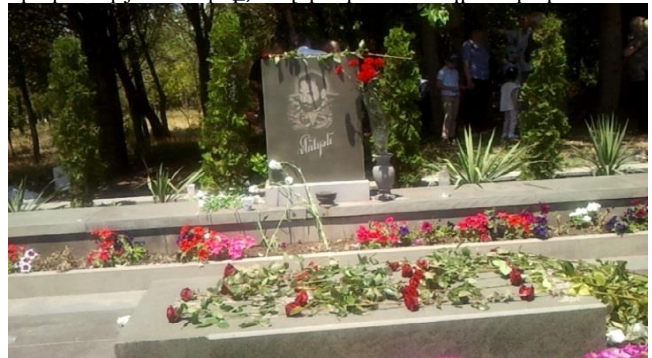
Մոնթեի հիշատակի օրը «Եռաբլուր» պանթեոնում

ոչինչ, Գո՛ւրգեն, բերածդ ռազմաներ շատ կօզնեն մեզի թե՛ նախապատրաստություններու, թե՛ մարտական գործողություններու ատեն, անոնց շնորհիվ է, որ մեր գորախումբերու միջև կապ կըլլա, մեր առավելությունն է աստիկա, բայց դուն գիտե՛ս, որ մենք հեռադիտակներու պակասություն ունինք, սովորական հեռադիտակներու: