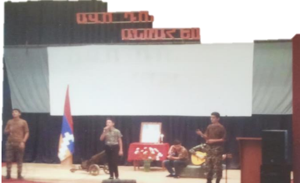
Մեր օրերում այսպես է տարածվում Մոնթեի լեզենդը

Պատերազմ է հիմա, դաժան, զոհեր պահանջող անողորք պատերազմ: Մենք մեր բոլոր ուժեր պիտ ներդնենք, կազմակերպված կռվինք այս պատերազմում հաղթելու և խաղաղություն հաստատելու համար: Շատ հողեր, թանկեր, գենքեր գրավեր ենք, սակայն թշնամու ձեռք դեռ շատ հայկական հողեր կան: Անոնք ալ պիտ գրավենք: Կրցած եմ հաղթելու հավատ ներշնչել մեր զինվորներուն: Կարող ենք հաղթել, եթե ապուշություններ չընենք: Միայն մեր հաղթանակով կհաստատվի խաղաղությունը: