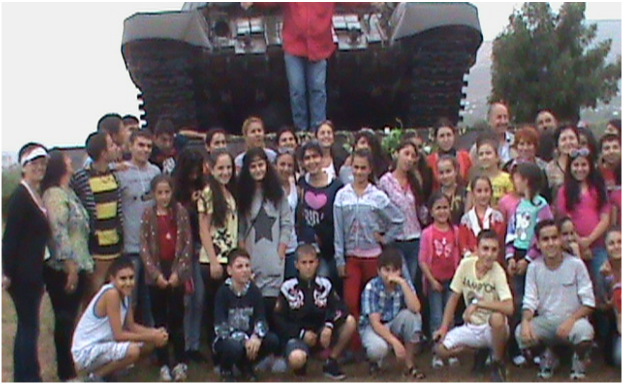
Փառատոնի մասնակիցները Արցախում շրջագայելիս. Գանձասարի ճանապարհին՝ ազերիներից գրաված տանկի մոտ ՄԵՐ ԱՎԱԳ ԲԱՐԵԳՈՐԾԸ