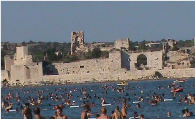
Կիլիկիա. Կոռնիկոսի հայկական ծովափնյա բերդերից մեկն ու լողափը, որոնց կարիքն ունի այսօրվա հայությունը