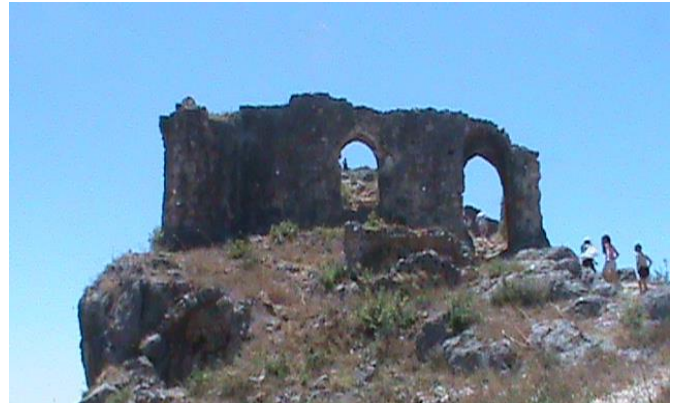
Սսի բերդի վերնամասը ծովի մակարդակից 2500 մ բարձր. ավելի վերևում կաթողիկոսարանն է