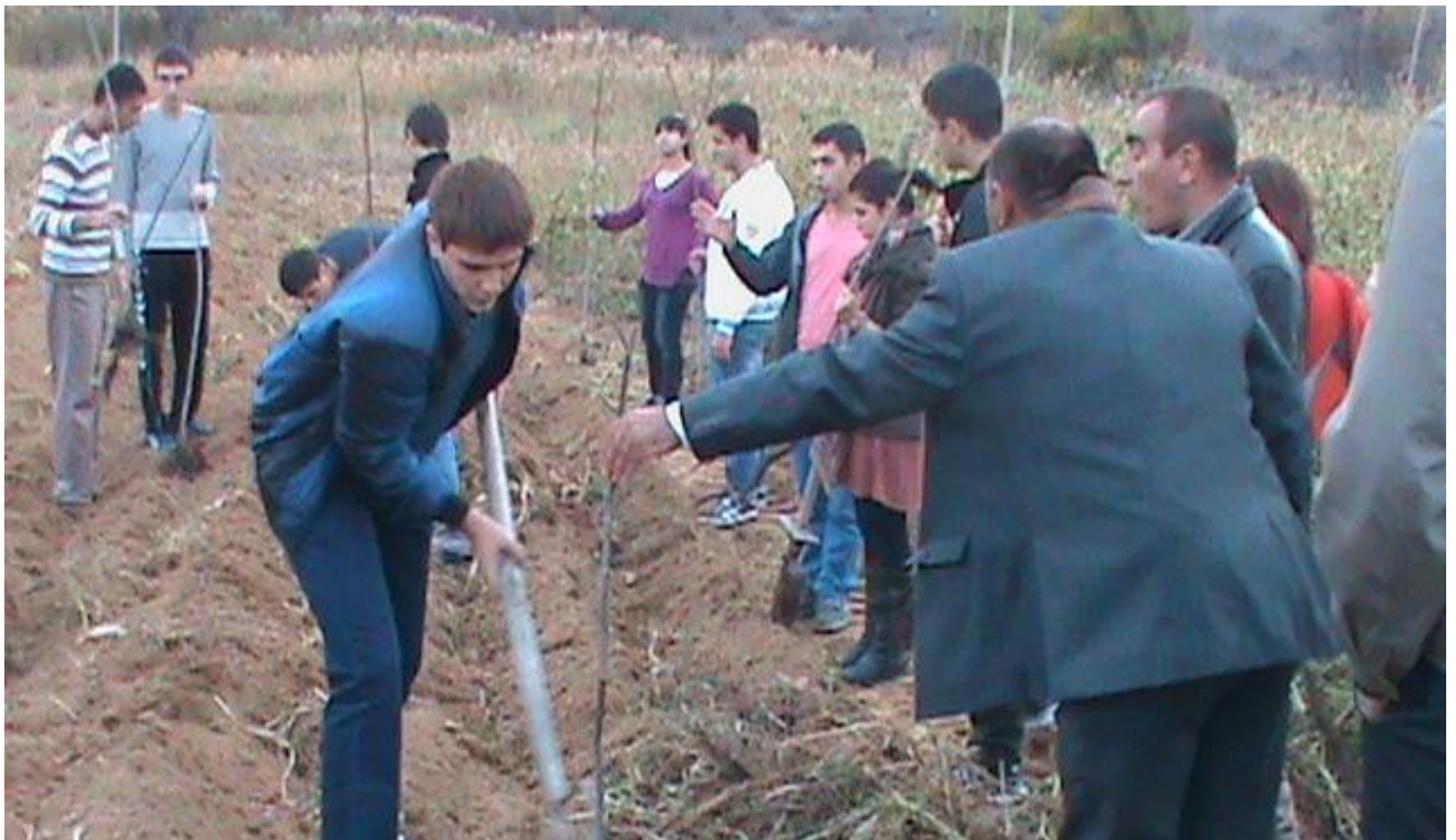
Ուսանողները Կովսականում ծառատունկով հիմնում են Երևանի պետական համալսարանի անվան Նոր պուրակը

Նախորդ նոյեմբերի սկզբին համալսարանականները հերթական անգամ Արցախ այցելեցին ազատագրված ու արդեն հայաշունչ Կովսականով, հանդիպեցին ՀՀ Ազգային հերոս Թաթուլ Կրպեյանի անվան դպրոցի աշակերտությանը, տեղի բնակիչներին ու սիրիահայ գաղթականներին: Համերգային ծրագրի իրականացվեց աշակերտների և ուսանողների ուժերով: Հայոց հինավուրց հողի վրա հնչեցին