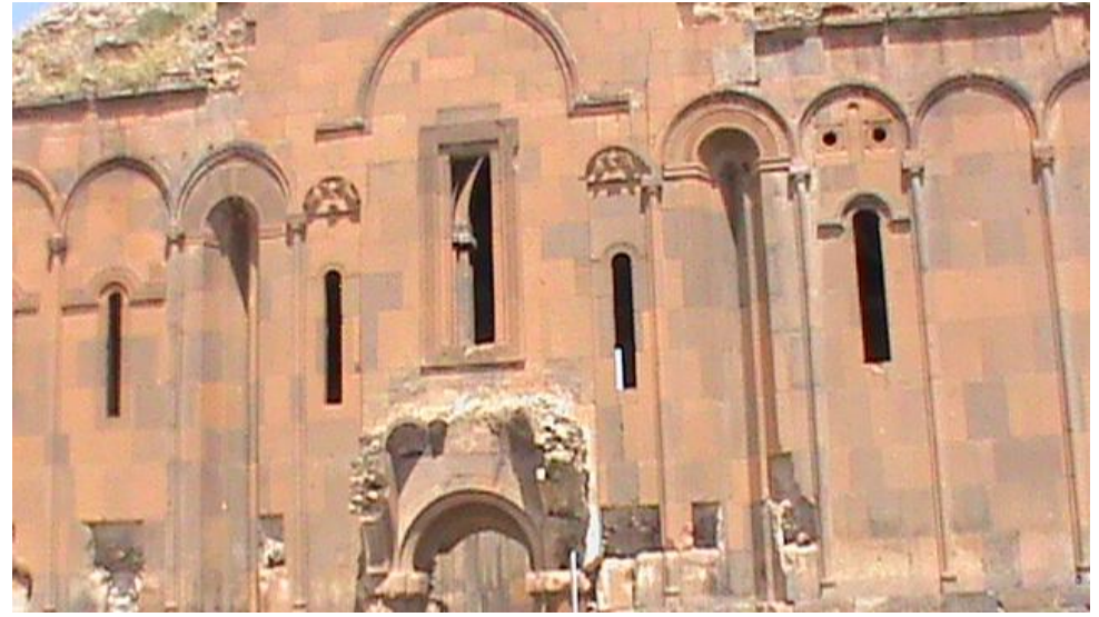
Չայ արվեստի դու փշրված Մասիս, Ամմահության աճյունն ես դու, Անի (Հ. Շիրազ)