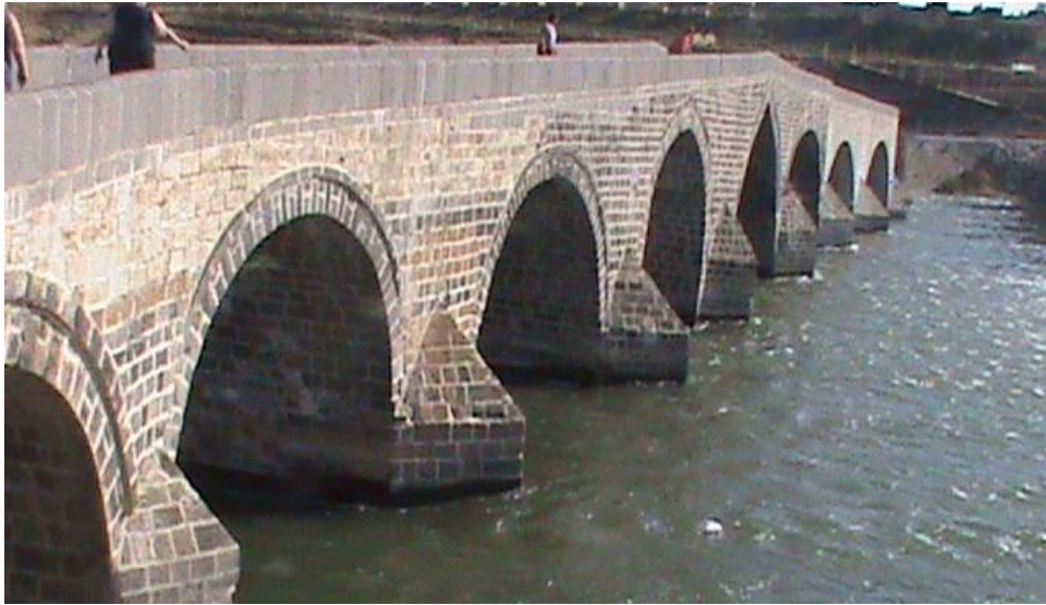
Սուլուխի վերանորոգված կամուրջը Արածանի վրա՝ Մուշի մոտ