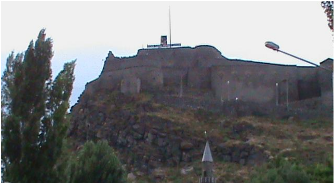
Կարսի բերդը. «Դավաճանությունը, նաիրյան ստոր դավաճանությունն է բերդը հանձնել եկվոր սրիկաներին» (Ե. Չարենց, Երկիր Նաիրի)