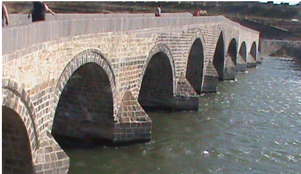
Սուլուխի վերանորոգված կամուրջը Արածանիի վրա՝ Մուշի մոտ