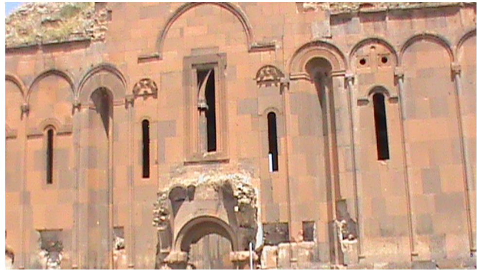
Հայ արվեստի դու փշրված Մասիս, Անմահության աճյունն էս դու, Անի (Հ. Շիրազ)

Համարի նյութերը, շարվածքը, լուսանկարները և ծևավորումը Ս. Մուրադյանի: Տպաքանակ՝ 99: Խմբագրության հասցեն՝ Երևան, 375025, Աբովյան 52 ա, հայ բանասիրության ֆակուլտետի մասնաշենք, 215 սենյակ Հեռ. 54- 43 – 91 + 1- 18, քջ. 055-52-29-36, 55-25-37: