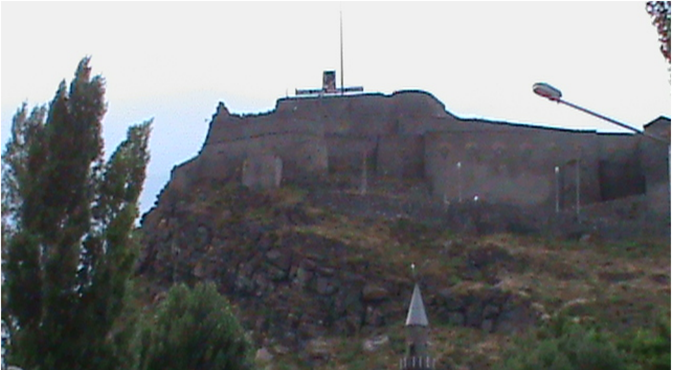
Կարսի բերդը. «Դավաճանությունը, նաիրյան ստոր դավաճանությունն է բերդը հանձնել եկվոր սրիկաներին» (Ե. Չարենց)

«ԳՈՒՐԳԵՆ ՄԵԼԻՔՅԱՆԻ» ԲԱՇԱԲԱԴԻ ԲԱԶՄԱԶԱԿԱԿ ԸՆՏԱՆԻՔՆԻ ԿԻՄՆԱԴՐԱՄԻ» ԵՌԱՄՅԱ ՊԱՇՏՈՆԱԹԵՐԹ ՄԵՐ ԱՆՑՅԱԼԻ ՓԱՌՔԵՐԻՑ